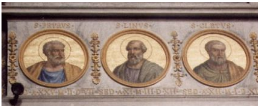
Podobizne prvých svätých pápežov (S. Petrus, S. Linus a S. Cletus) v bazilike sv. Pavla za hradbami v Ríme. Za nimi nasleduje svätý Kliment.

V januári 861 jeho pozostatky našiel svätý Cyril počas svojej cesty ku Kozárom. Ostatky priniesol v roku 863 počas svojho pôsobenia u nás na Veľkú Moravu a v roku 867 do Ríma. V tých dobách sa ostatky svätých veľmi ctili. Klimentove ostatky s veľkou poctou v Ríme privítal pápež Hadrián II. a pomohli svätému Cyrilovi, svätému Metodovi a ich učeníkom dosiahnuť u pápeža schválenie staroslovenčiny za štvrtý liturgický jazyk, popri latinčine, gréčtine a hebrejčine a čo do 20. storočia žiaden pápež znova neurobil.°